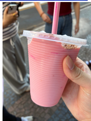
△ジャバのシェイク