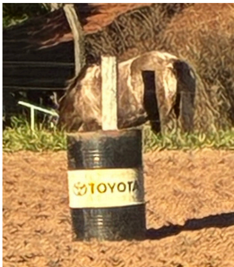
◀馬にのるところにあったトヨタのドラム缶